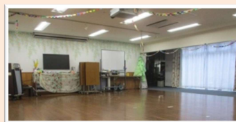
デ イ ル ー ム