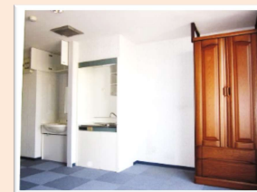
備 え 付 け 家 具